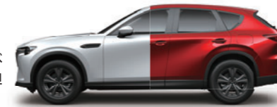
3年型(37回払い、1,000kmタイプ)のお支払いイメージ